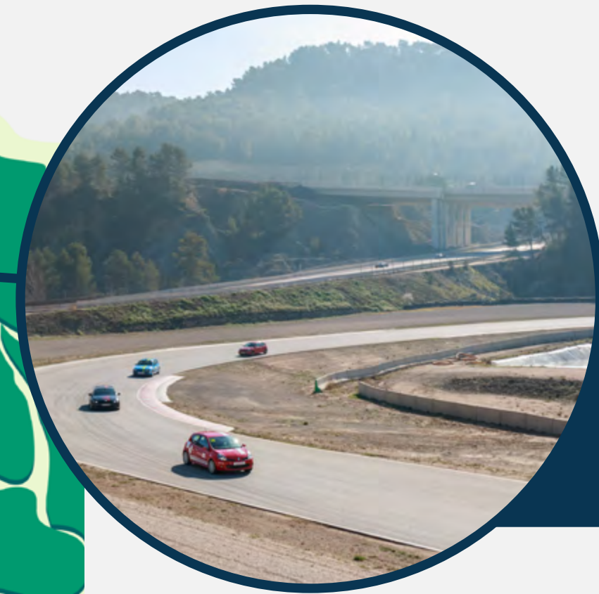
PISTA DE VELOCITAT